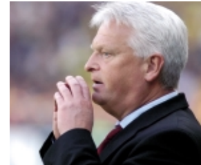
Cheftræner: Hans Backe

Jeg tror ikke, det har den store betydning. Så tidligt på sæsonen lægger man ikke rigtig pres på modstanderen ved at spille dagen før, og det er kun, hvis man har en midtugekamp, at det kan være en ulempe. Mod Herfølge forventer jeg en tæt kamp, ligesom vi har set mange gange før, hvor modstanderne sætter på kontra, og vi er spillestyrende, men jeg håber, vi kan spille os frem til målchancer og være skarpere foran målet.