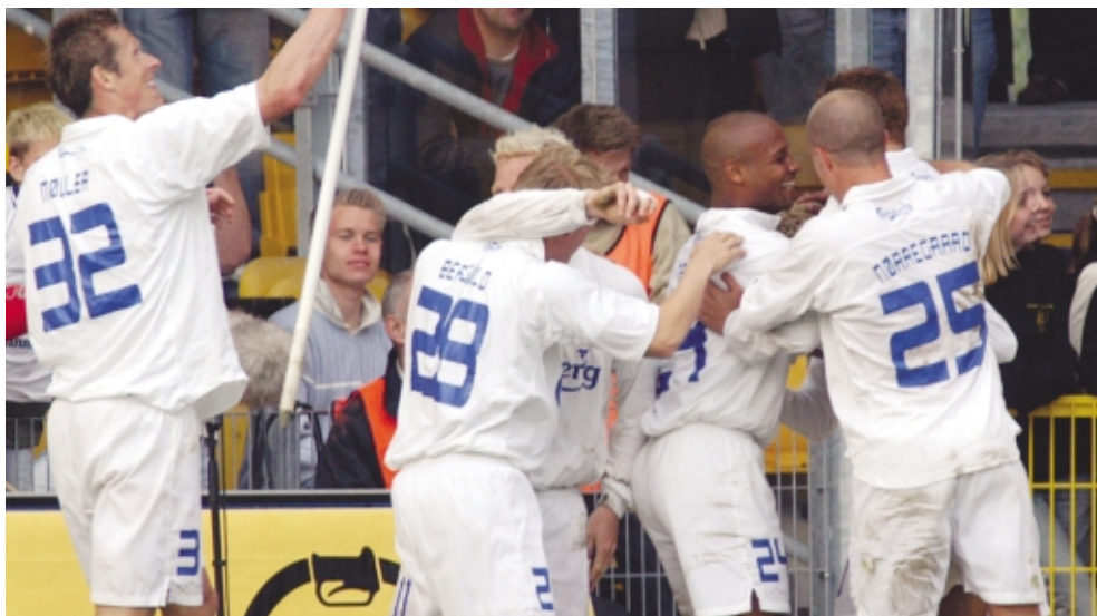
F.C. København vinder 1-0 over Farum, og 1. pladsen er igen FCKs...

Vi har i F.C. København på intet tidspunkt haft grund til at tvivle på vore egne muligheder. Uanset om resultaterne i fodboldkampene går vores vej eller ej, uanset om vi føler