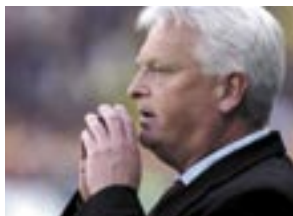
Cheftræner: Hans Backe

Jeg håber på at vi får optimal støtte fra lægterne, det betyder ufattelig meget for os. Hvis man ikke får denne støtte, der er i høj grad er med til at lægge pres på modstanderne, er det meget svært at vinde de europæiske kampe på hjemmebane. Så enkelt kan det siges!