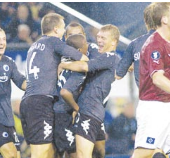
Den lille mand med det store repertoire bliver tiljublet efter udligningen i den første kamp mod HSV, der som bekendt endte 1-1.